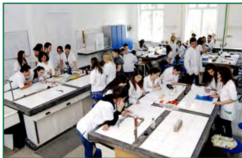
Universitatea de Medicină și Farmacie "Iuliu Hațieganu" din Cluj-Napoca - laborator