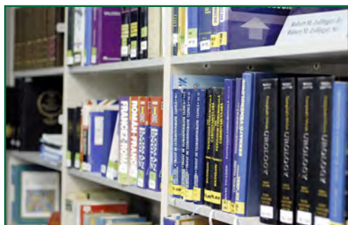
Universitatea de Medicină și Farmacie “Iuliu Hațieganu” din Cluj-Napoca – biblioteca