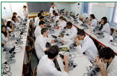
Universitatea de Medicină și Farmacie „Iuliu Hațieganu” din Cluj-Napoca – laborator

Universitatea de Medicină și Farmacie „Iuliu Hațieganu” din Cluj-Napoca are în proprietate o parte importantă din spațiile destinate procesului de învățământ pentru programul de studii de licență Medicină. Pentru desfășurarea stagiilor clinice și de practică de vară, Facultatea a încheiat protocoale de colaborare, cu unitățile din rețeaua medicală: Spitalul Clinic Județean de Urgență Cluj, Spitalul Clinic de Urgență „Octavian Fodor”, Spitalul Clinic de Recuperare, Spitalul Clinic de Boli Infecțioase, Spitalul Clinic