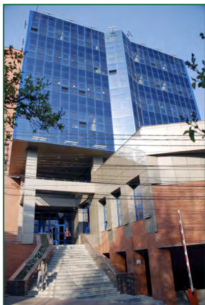
Universitatea de Medicină și Farmacie “Iuliu Hațieganu” din Cluj-Napoca - rectorat

Universitatea de Medicină și Farmacie “Iuliu Hațieganu” din Cluj-Napoca este o instituție de învățământ superior de stat, actul de înființare fiind emis prin decizia Ministerului Învățământului Public în data de 26.10.1948; MS – 15.12.1984 și Ministerului Învățământului și Științei – 23.03.2009. Învățământul superior de medicină din Transilvania, a fost înființat în anul 1872, prin Decret Regal. Facultatea de Medicină cu limba de predare - română, a fost înființată, cu denumirea actuală în anul 1919 în cadrul Universității Daciei Superioare, primul ei decan fiind Iuliu Hațieganu.