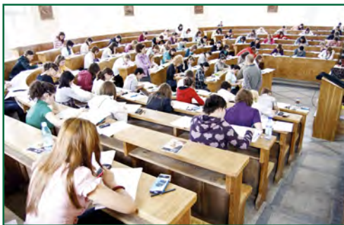
Universitatea de Medicină și Farmacie "Iuliu Hațieganu" din Cluj-Napoca – examen

Admiterea candidaților la specializările din cadrul facultăților Universității de Medicină și Farmacie "Iuliu Hațieganu" din Cluj-Napoca, la programe de studii de licență, masterat și doctorat se face respectând legislația în vigoare și metodologiile de admitere aprobate de Senat. Singurul criteriu de admitere este rezultatul obținut la concurs.