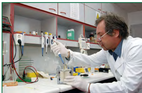
Universitatea de Medicină și Farmacie "Iuliu Hațieganu" din Cluj-Napoca – cadru didactic

La nivelul Universității de Medicină și Farmacie "Iuliu Hațieganu" din Cluj-Napoca,