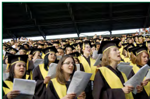
Universitatea de Medicină și Farmacie “Iuliu Hațieganu” din Cluj-Napoca – festivitatea de absolvire