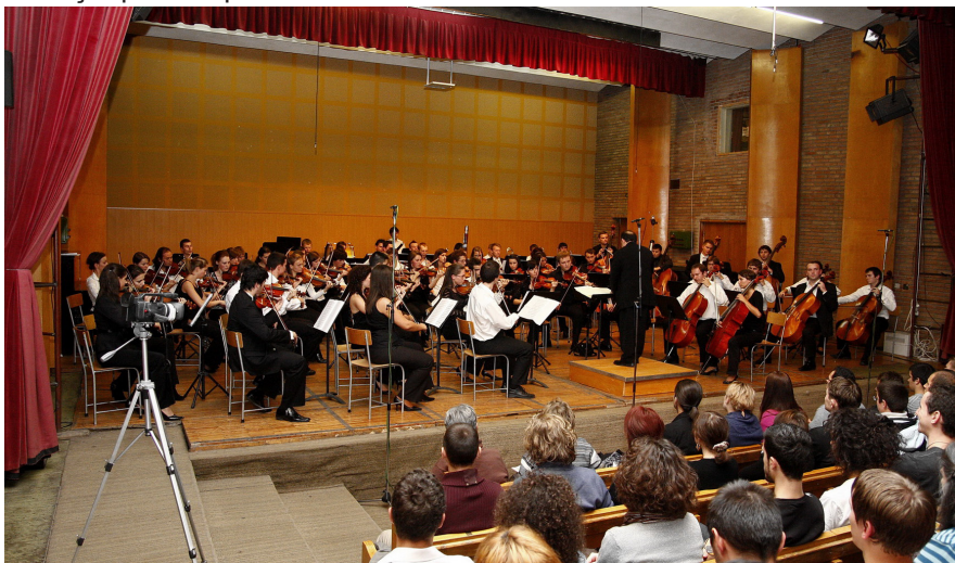
Academia de Muzică „Gheorghe Dima” din Cluj-Napoca- Concert în Sala de Spectacole

Academiei un sistem de „rezervare” a sălilor de către studenți, prin bilețele, în afara orarului oficial, pe principiul „primul venit, primul servit”. Studenții își încep activitatea în general de la ora 5 dimineța, până seara la 22, Academia oferindu-le posibilitatea de a folosi sălile și în afara programului de studiu. Studenții nu pot, conform regulamentului, să studieze la instrument în cămin, acest lucru fiind practic imposibil și pentru studenții chiriași, unii fiind dispuși să plătească o chirie pentru câteva ore, în apropierea Academiei, pentru a dispune de o cameră izolată unde să cânte la instrumentele muzicale. Aceste amănunte aduse în discuție au menirea de a atrage atenția asupra necesității de spațiu pentru desfășurarea în condiții optime a procesului academic.