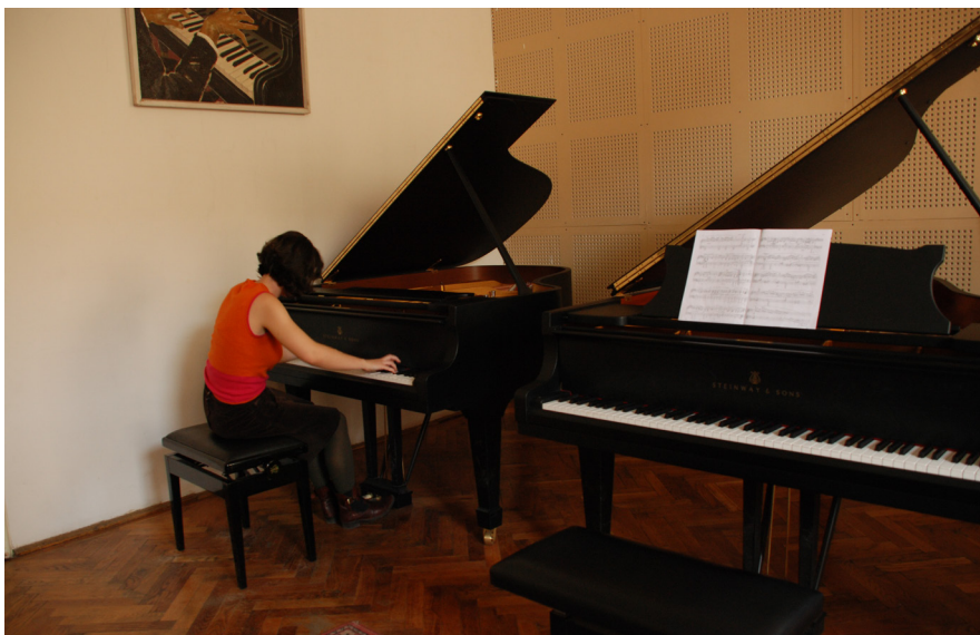
Academia de Muzică „Gheorghe Dima” din Cluj-Napoca- Studiu la pian

Activitățile aplicative la disciplinele de specialitate au nevoie, în AMGD, de instrumente muzicale performante, printre care 134 de instrumente cu claviatură, 96 instrumente de suflat, 57 instrumente de percuție, 48 instrumente cu coarde. Există, pentru acele discipline de învățământ care necesită tehnică de calcul, PC-uri (35), laptop-uri (19), imprimante puse la dispoziția studenților. Menționăm că în cadrul AMGD există o un curs de „Informatică muzicală”, disciplină opțională, care se desfășoară în laboratorul de informatică.