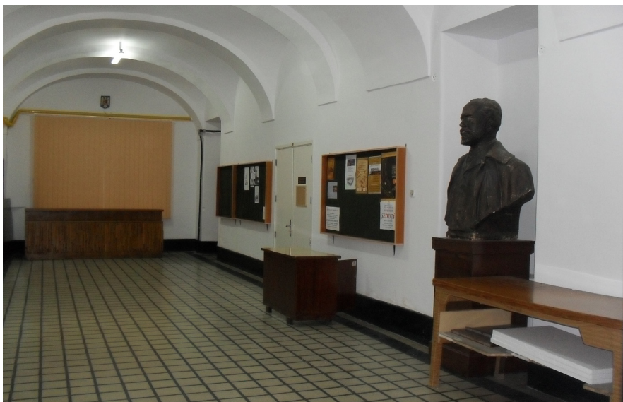
Academia de Muzică „Gheorghe Dima” din Cluj-Napoca- Interior Etaj I

Auditul activității financiare a Universității se realizează prin audit intern și prin activitatea Curții de Conturi. Auditul intern verifică activitatea financiară, bilanțul contabil, contul de execuție bugetară, iar rezultatele auditării situațiilor financiare sunt analizate și aprobate de către Senat. Ultimul audit extern al Curții de conturi a avut loc în perioada 02.02-30.03.2007.