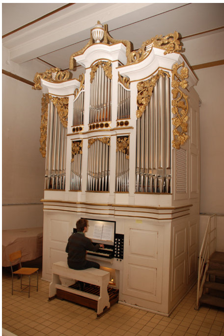
Academia de Muzică „Gheorghe Dima” din Cluj-Napoca Orga

Pe baza documentelor puse la dispoziție de către conducerea universității și a vizitelor efectuate în locațiile în care se desfășoară activități didactice și de cercetare, comisia a constatat că universitatea dispune de patrimoniul necesar desfășurării unui proces de învățământ de calitate, în concordanță cu planurile de învățământ și nr. de studenți. Toate rapoartele de evaluare a programelor de studii relevă faptul că numărul de locuri în sălile de curs, seminar și laborator este corelat cu mărimea formațiilor de studiu. Îndeplinirea, la termenele propuse, a prevederilor Planurilor de dezvoltare și investiții va schimba spectaculos nivelul și funcționalitatea spațiilor de studiu și cazare oferite studenților.