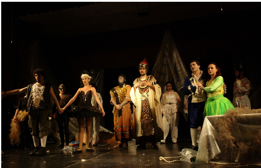
Academia de Muzică „Gheorghe Dima” din Cluj-Napoca- Scena din spectacolul susținut de studenți