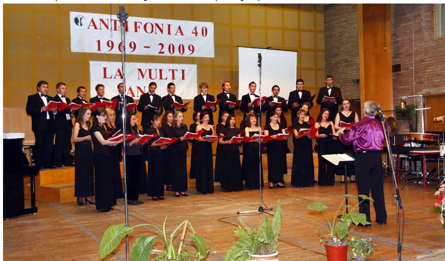
Academia de Muzică „Gheorghe Dima” din Cluj-Napoca- Corul Antifonia

Spațiile alocate studiului individual, pentru învățământul artistic muzical, sunt toate sălile de curs, seminar, lucrări practice, inclusiv laboratoarele, în afara orarului (în intervalul orar 6:00-22:00, inclusiv sâmbăta și duminica), întrucât au nevoie de instrumente. Datorită spațiului restrâns pe care studenții îl au la dispoziție pentru studiu, s-a creat în cadrul