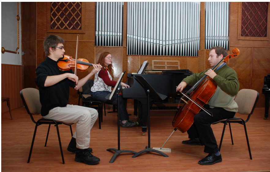
Academia de Muzică „Gheorghe Dima” din Cluj-Napoca- Repetiție violoncel

Universitatea are o editură - MediaMusica - recunoscută CNC SIS, o tipografie și un atelier de multiplicare, care asigură multiplicarea cursurilor și a celorlalte materiale necesare procesului de învățământ și de cercetare. Studenților le este pus la dispoziție un Copiator cu cartelă magnetică Workcentre 5225, în incinta Bibliotecii.