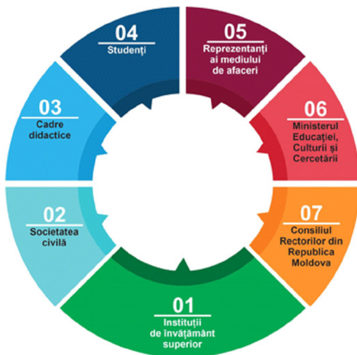
Figura 1 – Categoriile de părți interesate în activitățile de asigurare externă a calității desfășurate de ANACEC

Astfel, părțile interesate identificate sunt prezentate în următoarea diagramă (Figura 1):