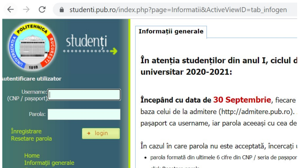
Fig.A.5. 2. Interfața sistemului informatic pentru evidența parcursului academic al studenților-doctoranzi din cadrul IOSUD-UPB, conform IP.A.1.2.1.

Anexa 1. Organizarea școlilor doctorale în 2012