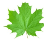
Figura 2. Text și siglă de promovare a dezvoltării durabile

Împreună salvăm natura! Una dintre valorile noastre este grija față de mediu. Proiectul QAFIN susține și promovează dezvoltarea durabilă. Vă rugăm să (re)printați acest conținut/document doar dacă este absolut necesar. Vă mulțumim.